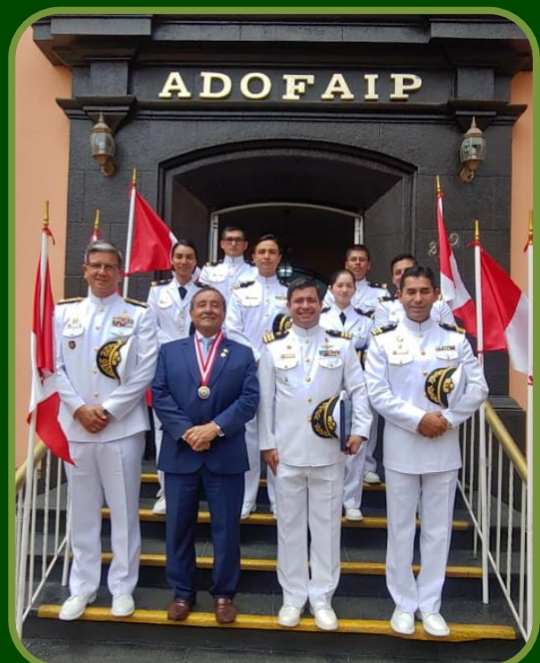
Presidente de ADOFAIP con el Comandante General y Comisión de la Marina de Guerra del Perú