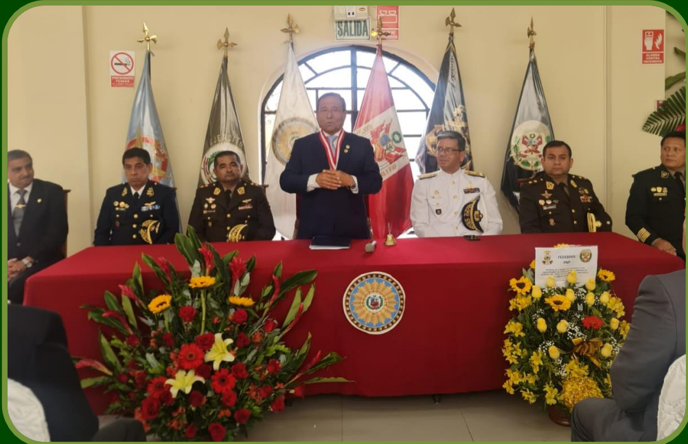
Presidente de ADOFAIP aperturando Sesión Solemne con los Comandantes Generales de las FFAA y PNP