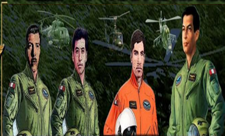
Néstor Escudero Otero Mayor - Piloto Héroe del Cénepa Cénepa, 13 feb 1995