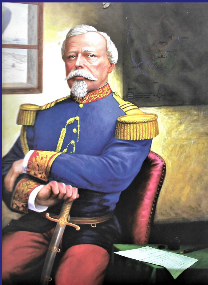
"CORONEL BOLOGNESI JUNTO A SU ESCRITORIO Y SU ÚLTIMA CARTA".

El Día del Soldado Peruano nos recuerda que el amor a la patria se expresa no solo con palabras, sino con acciones concretas de entrega, disciplina y coraje. Hoy más que nunca, el Perú reconoce a sus soldados como auténticos héroes del presente, herederos de una historia gloriosa y forjadores de un futuro lleno de esperanza.