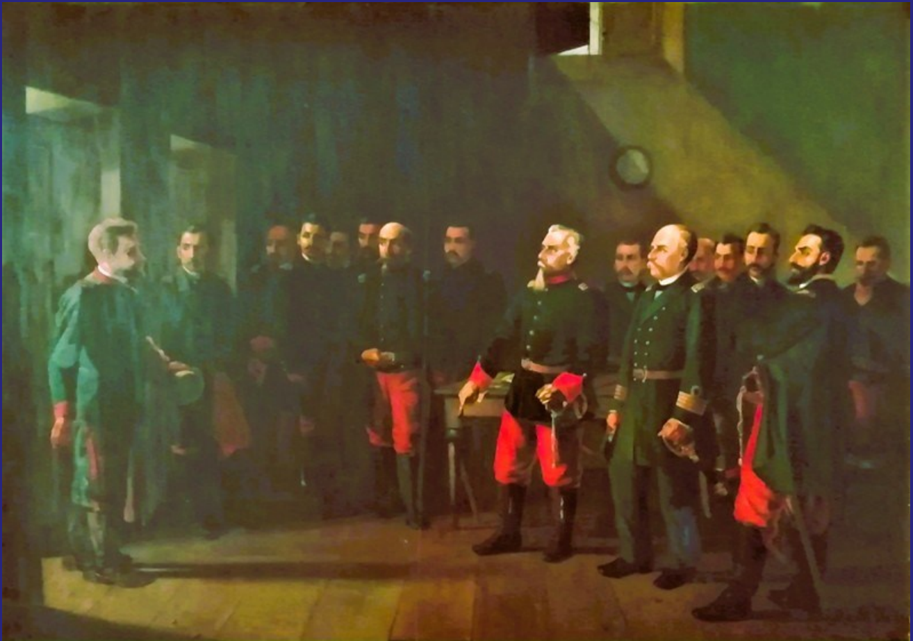
ARICA 5 DE ABRIL 1879 VALEROSA RESPUESTA FRANCISCO BOLOGNESI