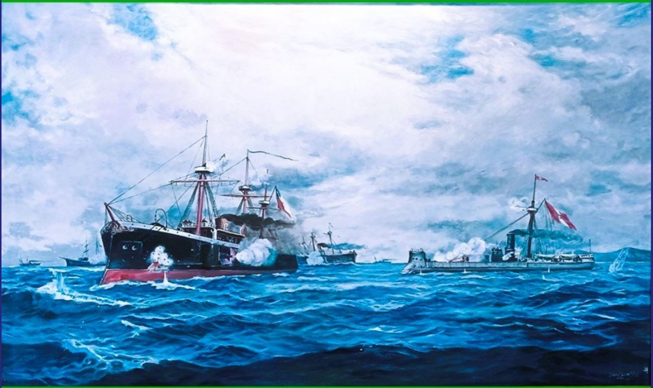
PUNTA ANGAMOS: 8 DE OCTUBRE 1879, MIGUEL GRAU EL "HUASCAR"