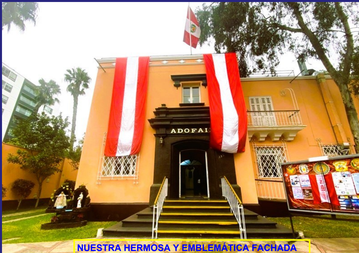
NUESTRA HERMOSA Y EMBLEMÁTICA FACHADA