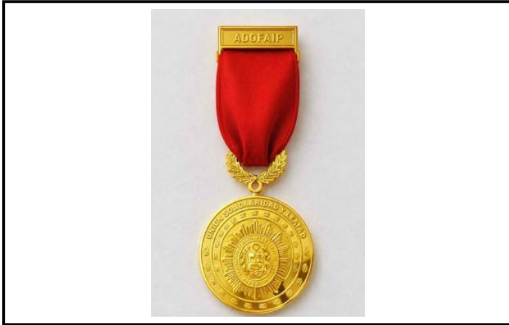
Lámina 11 (Medalla al Mérito de la ADOFAIP - Oficial)