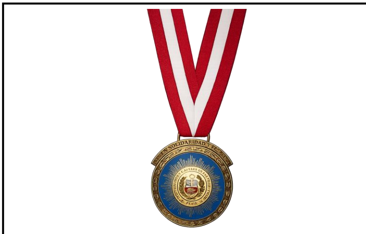
Lámina 5 (Medalla Institucional)