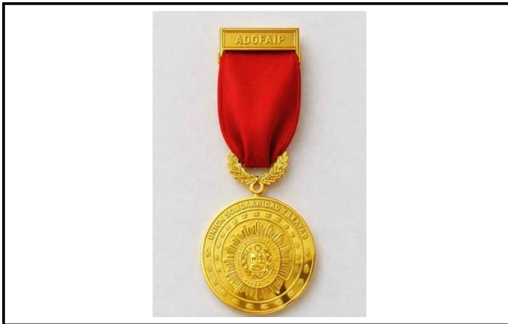
Lámina 12 (Medalla al Mérito de la ADOFAIP - Caballero)