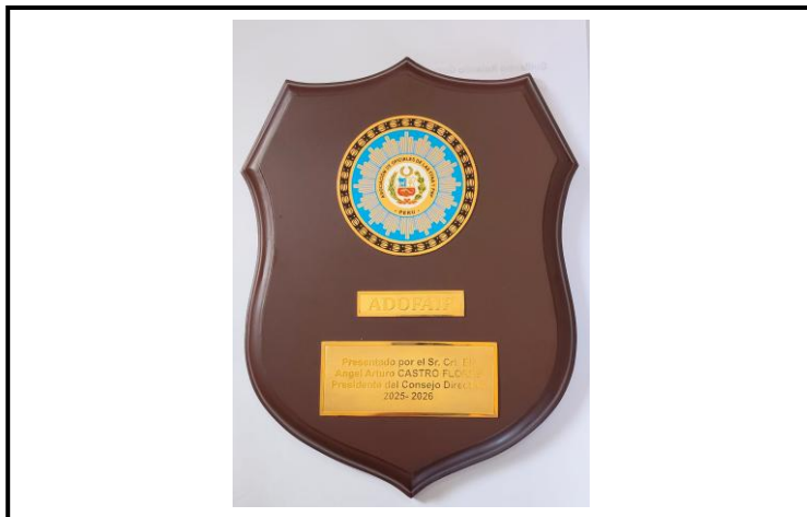
Lámina 13 (Reconocimientos – Placa Recordatoria)