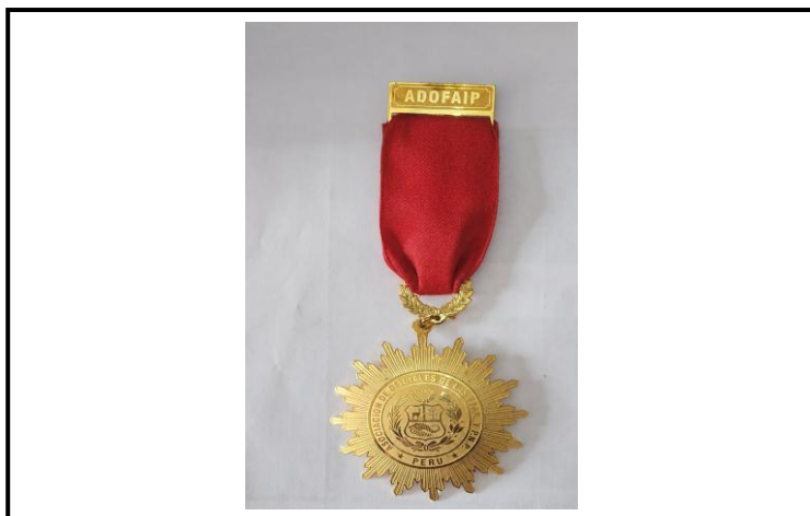
Lámina 9 (Medalla de Honor de la ADOFAI - Comendador)