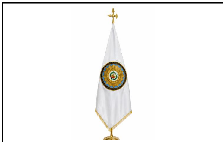
Lámina 2 (Estandarte Institucional)