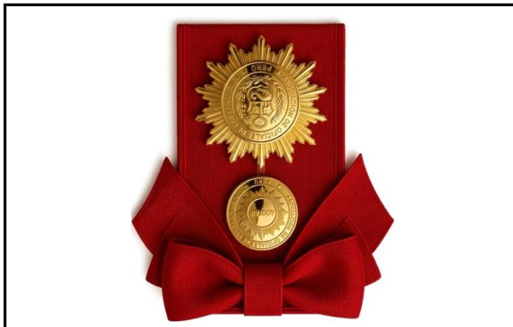
Lámina 7 (Medalla de Honor de la ADOFAIP - Gran Cruz)