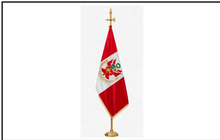
Lámina 1 (Estandarte de ADOFAIP)