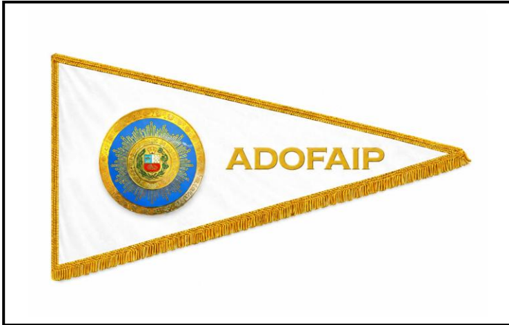
Lámina 3 (Gallardete de la ADOFAIP)