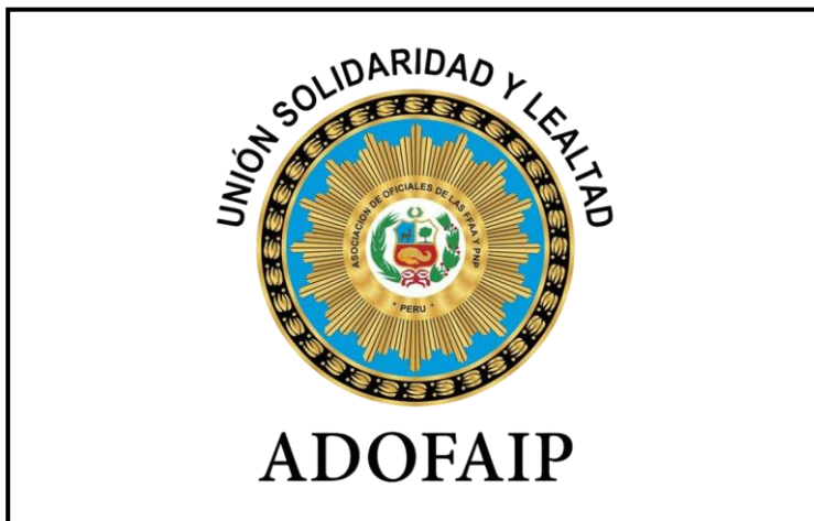
Lámina 7 (Escudo-Logo de la ADOFAIP)