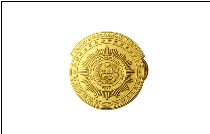
Lámina 4 (Solapero Institucional)